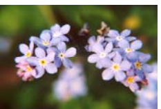
vergeet me nietje